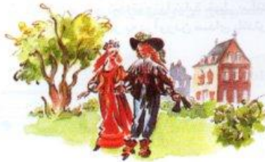
Dancing a sarabande

سارا باند اصالتاً مربوط به قرن شانزده اسپانیا می باشد آن به بعد به آهنگهای آهسته با سه ضرب در میزان باندها نامیده اند. غالباً آنها با ریتم استفاده شده در آهنگ شروع می شود.