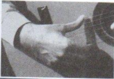
پوزیسیون دست در شروع ضربه به سیم ششم

بیاید این ضربه را امتحان کنیم. فرض کنید میخواهید سیم ششم را به صدا درآورید. شست را بدون اینکه خم شود روی سیم ششم بگذارید. حالا با فشار رو به پایین آن را به صدا درآورید بطوریکه پس از ضربه، شست روی سیم پنجم قرار گیرد. عکسهای زیر، شروع و پایان ضربه را نشان میدهند: