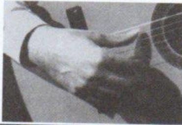
در پایان ضربه به سیم ششم، شست روی سیم پنجم قرار گرفته و به آن تکیه کرده است.